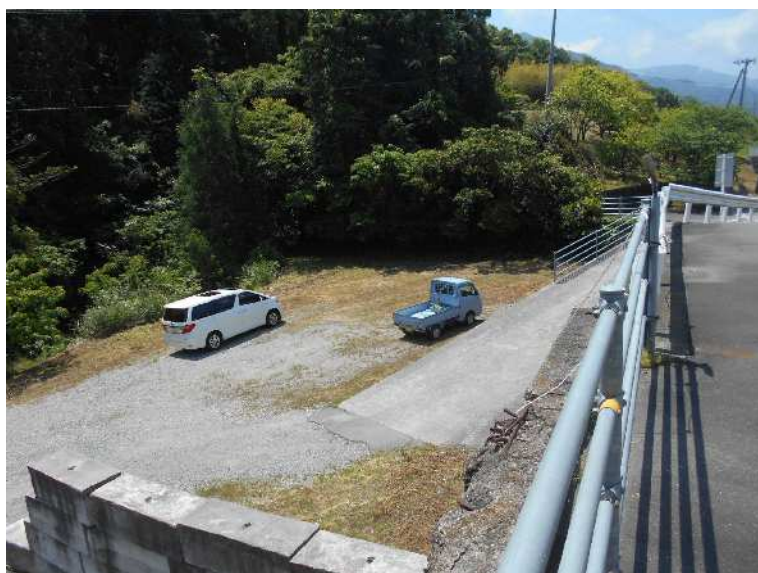
空きスペース南側