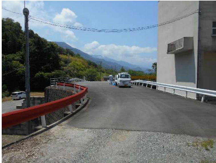
建物東側敷地内道路