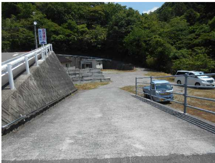
空きスペース南側スロープ