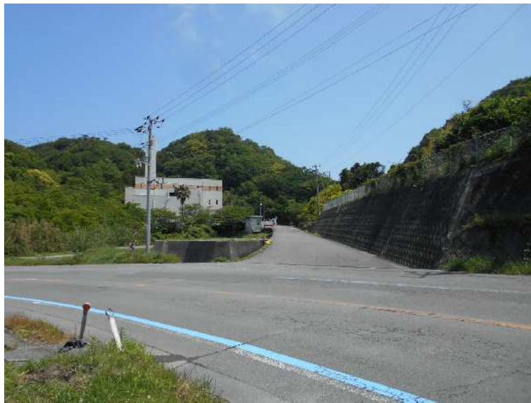
敷地南側国道378号より