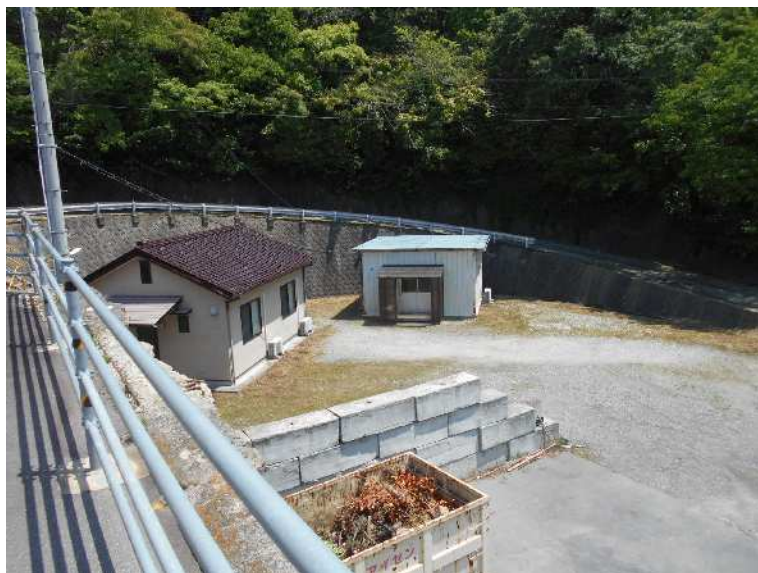
空きスペース北側