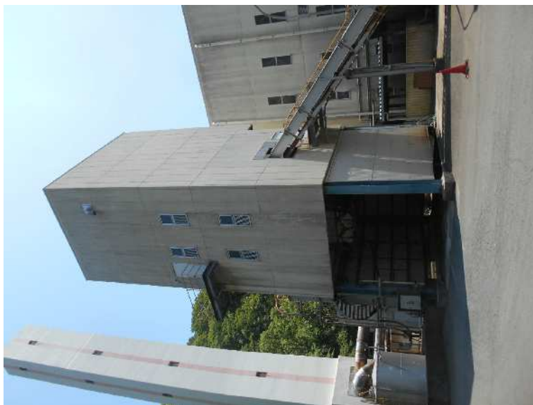
建物西面 灰固形化处理棟