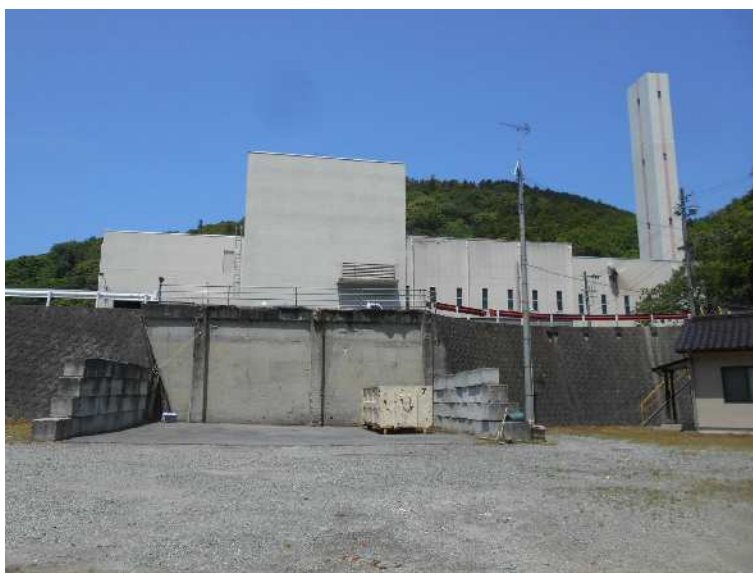
空きスペース西側